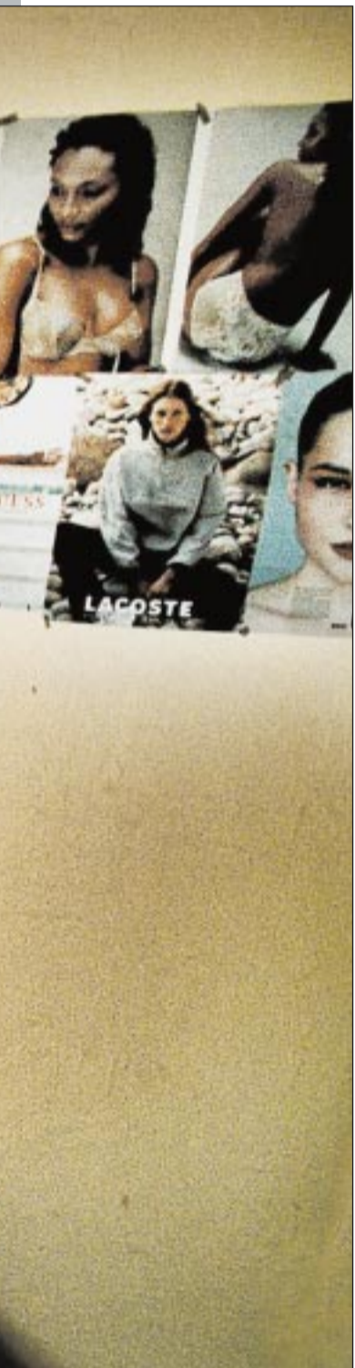
arna trängs kramdjuren.