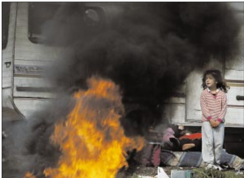
Mitt i lägret utanför den italienska huvudstaden Rom eldar familjerna sopor för att hålla värmen. I lägret bor cirka 400 människor.

I nomadlägret har fattigdomen dödat sex unga på ett år