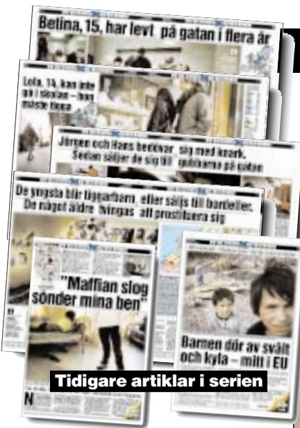
Tidigare artiklar i serien